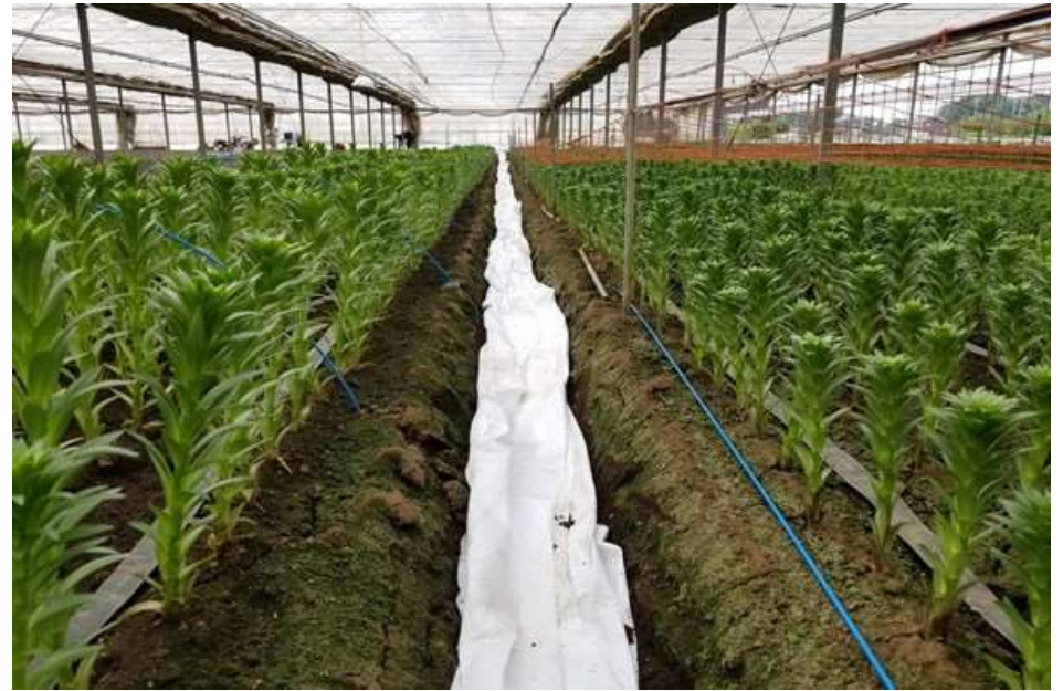
写真4 8/19 被覆除去2日後