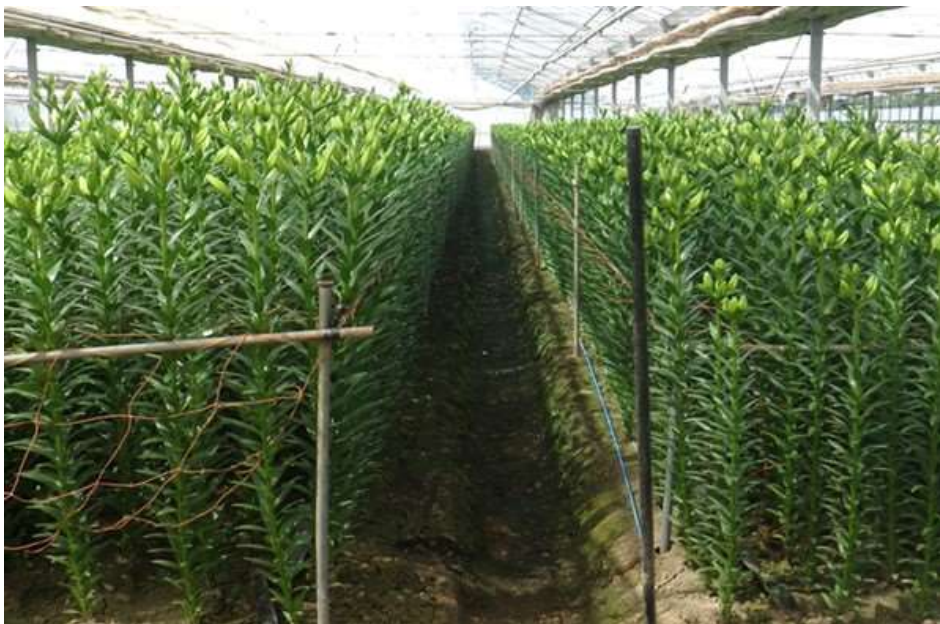
写真5 9/12 収穫期 左：遮光区 右：慣行