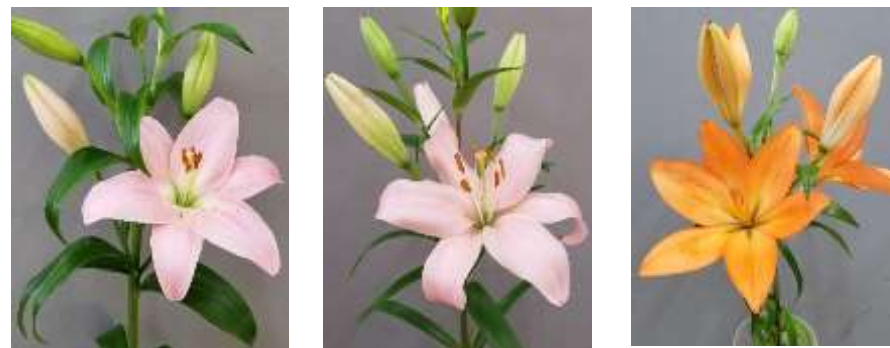
写真7：（左から）ピガレ、イモラ、アミーガ