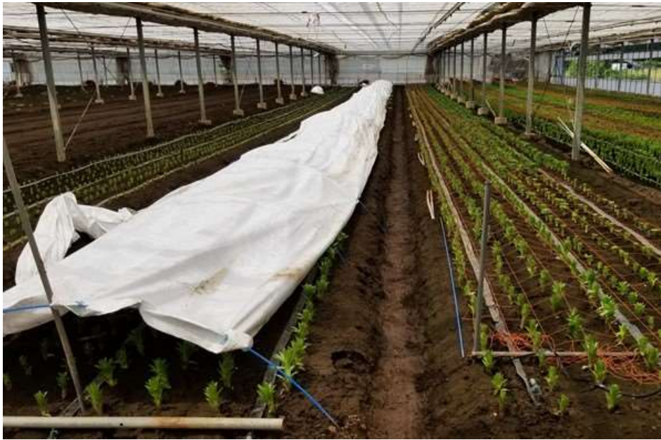
写真3 8/13 被覆後3日目