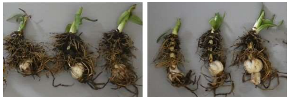
写真6 収穫後の発根状況 左：遮光区 右：慣行