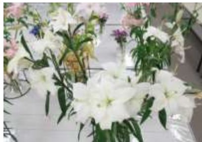
リトーウィン（チリ産）