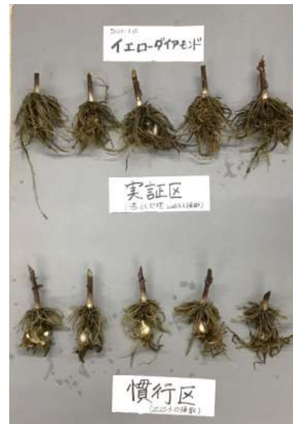
写真2：2作目収穫時の根の様子 （上）湛水処理（下）慣行 （品種イエローダイヤモンド）