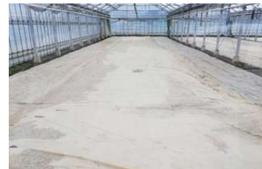
写真1：湛水処理後のバスアミド処理