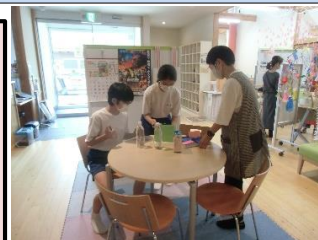
〈夏休みボランティア〉

【長瀬中学校ホームページ】 park10.wakwak.com/~torojhs/