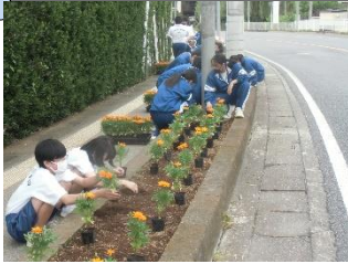
〈国道花植ボランティア〉