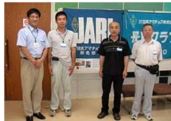
←支部大会 ←会場クラブ旗の前 で JFØFDT JGØSYA JAØBYV JHØEHG